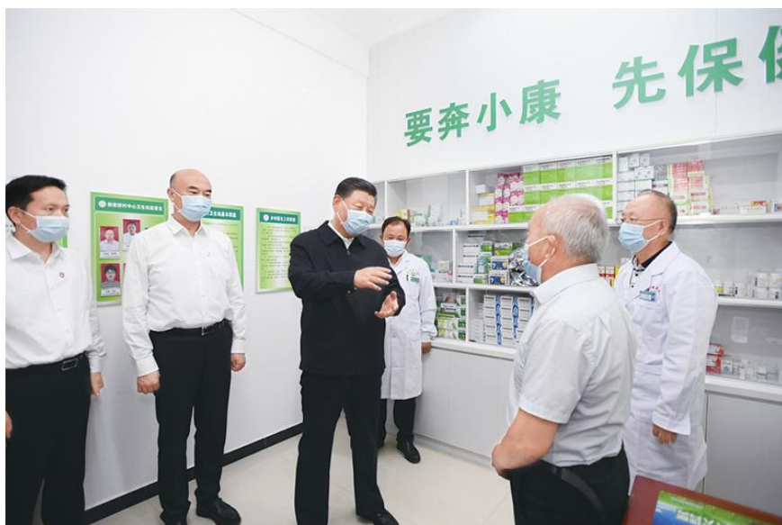
2021年9月13日至14日，中共中央总书记、国家主席、中央军委主席习近平在陕西省榆林市考察。这是14日下午，习近平在绥德县张家砭镇郝家桥村卫生站同村里的老人、医护人员亲切交流。新华社记者 李学仁/摄

社会条件、文化特征不同，社会保障制度必然多种多样。我们注重学习借鉴国外社会保障有益经验，但不是照抄照搬、简单复制，而是立足国情、积极探索、大胆创新，成功建设了具有鲜明中国特色的社会保障体系。我们坚持发挥中国共产党领导和我国社会主义制度的政治优势，集中力量办大事，推动社会保障事业行稳致远；坚持人民至上，坚持共同富裕，把增进民生福祉、促进社会公平作为发展社会保障事业的根本出发点和落脚点，使改革发展成果更多更公平惠及全体人民；坚持制度引领，围绕全覆盖、保基本、多层次、可持续等目标加强社会保障体系建设；坚持与时俱进，用改革的办法和创新的思维解决发展中的问题，坚决破除体制机制障碍，推动社会保障事业不断前进；坚持实事求是，既尽力而为又量力而行，把提高社会保障水平建立在经济和财力可持续增长的基础之上，不脱离实际、超越阶段。我们要坚持和发展这些成功经验，不断总结，不断前进。