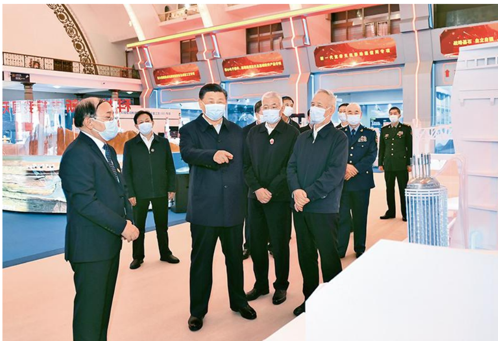
2021年10月26日，中共中央总书记、国家主席、中央军委主席习近平在北京展览馆参观国家“十三五”科技创新成就展。

当前，新一轮科技革命和产业变革突飞猛进，科学研究范式正在发生深刻变革，学科交叉融合不断发展，科学技术和经济社会发展加速渗透融合。科技创新广度显著加大，宏观世界大至天体运行、星系演化、宇宙起源，微观世界小至基因编辑、粒子结构、量子调控，都是当今世界科技发展的最前沿。科技创新深度显著加深，深空探测成为科技竞争的制高点，深海、深地探测为人类认识自然不断拓展新的视野。科技创新速度显著加快，以信息技术、人工智能为代表的新兴科技快速发展，大大拓展了时间、空间和人们认知范围，人类正在进入一个“人机物”三元融合的万物智能互联时代。生物科学基础研究和应用研究快速发展。科技创新精度显著加强，对生物大分子和基因的研究进入精准调控阶段，从认识生命、改造生命走向合成生命、设计生命，在给人类带来福祉的同时，也带来生命伦理的挑战。