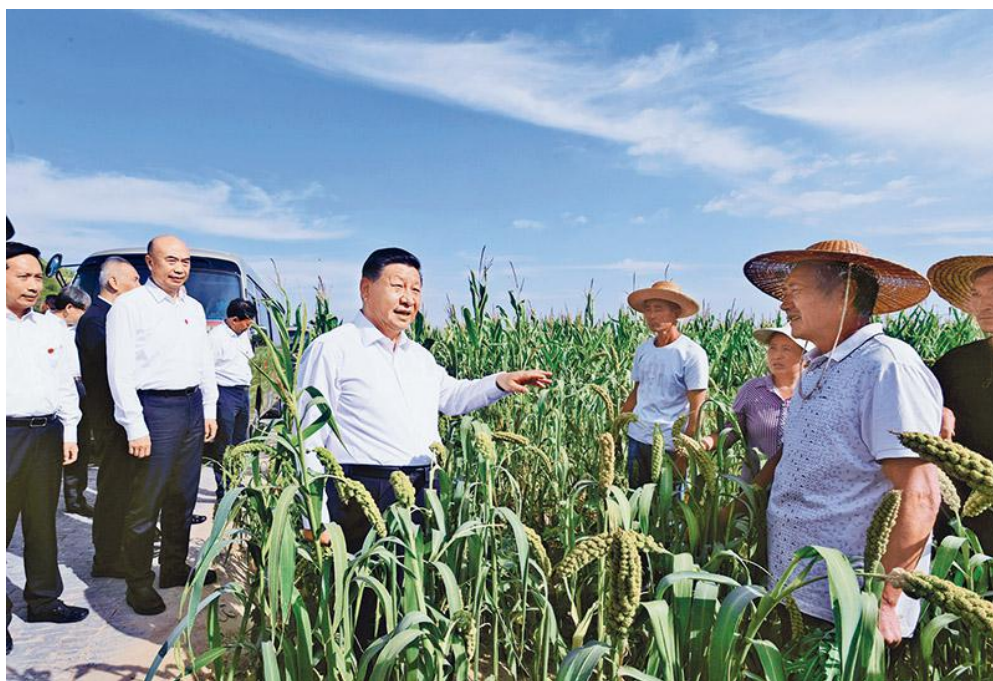
2021年9月13日至14日，中共中央总书记、国家主席、中央军委主席习近平在陕西省榆林市考察。这是13日下午，习近平在米脂县银州街道高西沟村临时下车，察看粮食作物长势，同正在田间劳作的老乡拉家常。

党的十八大以来，我们坚持把解决好“三农”问题作为全党工作的重中之重，把脱贫攻坚作为全面建成小康社会的标志性工程，组织推进人类历史上规模空前、力度最大、惠及人口最多的脱贫攻坚战，启动实施乡村振兴战略，推动农业农村取得历史性成就、发生历史性变革。农业综合生产能力上了大台阶，粮食产量连续6年稳定在1.3万亿斤以上。农民人均收入较2010年翻一番多，农村民生显著改善，乡村面貌焕然一新。贫困地区发生翻天覆地的变化，解决困扰中华民族几千年的绝对贫困问题取得历史性成就，为全面建成小康社会作出了重大贡献，为开启全面建设社会主义现代化国家新征程奠定了坚实基础。这些成绩是全党全国共同奋斗的结果，大家都付出了艰辛努力。