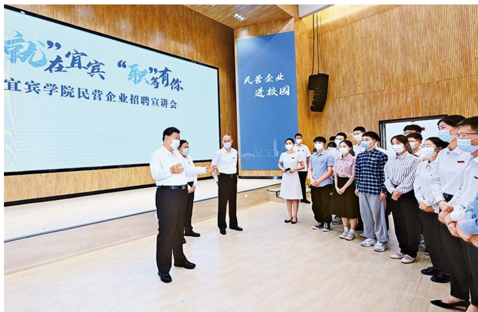
2022年6月8日，中共中央总书记、国家主席、中央军委主席习近平在四川考察。这是8日下午，习近平在宜宾学院考察时，向正在参加企业招聘宣讲会的教师、

质基础。我们不断发展全过程人民民主，推进人权法治保障，坚决维护社会公平正义，人民享有更加广泛、更加充分、更加全面的民主权利。我们推动实现更加充分、更高质量的就业，建成了世界上规模最大的教育体系、社会保障体系、医疗卫生体系，大力改善人民生活环境质量。我们坚持人民至上、生命至上，有力应对新冠肺炎疫情，最大限度保护了人民生命安全和身体健康。我们全面贯彻党的民族政策和宗教政策，坚持各民族一律平等，尊重群众宗教信仰，保障各族群众合法权益。我们深入推进司法体制改革，加强平安中国、法治中国建设，深入开展政法队伍教育整顿，全面开展扫黑除恶专项斗争，严厉打击各类违法犯罪，保持社会长期稳定，切实保护人民群众生命财产安全。我国是世界上唯一持续制定和实施四期国家人权行动计划的主要大国。我们积极参与全球人权治理，为世界人权事业发展作出了中国贡献、提供了中国方案。