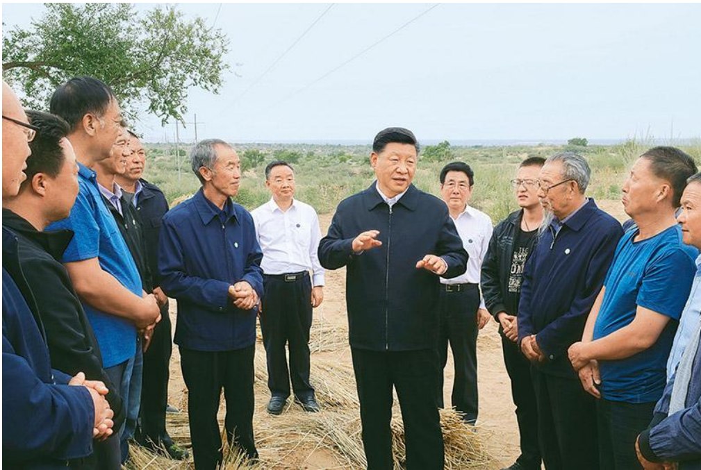
2019年8月19日至22日，中共中央总书记、国家主席、中央军委主席习近平在甘肃考察。这是21日上午，习近平在武威市古浪县八步沙林场同“六老汉”代表及林场职工亲切交谈。

一个认识误区就是借扩大内需、形成国内大市场之机，大搞高能耗、高排放的项目。有关部门和地方要严把关口，不符合要求的项目要坚决拿下来！各级党委和政府要拿出抓铁有痕、踏石留印的劲头，明确时间表、路线图、施工图，推动经济社会发展建立在资源高效利用和绿色低碳发展的基础之上。